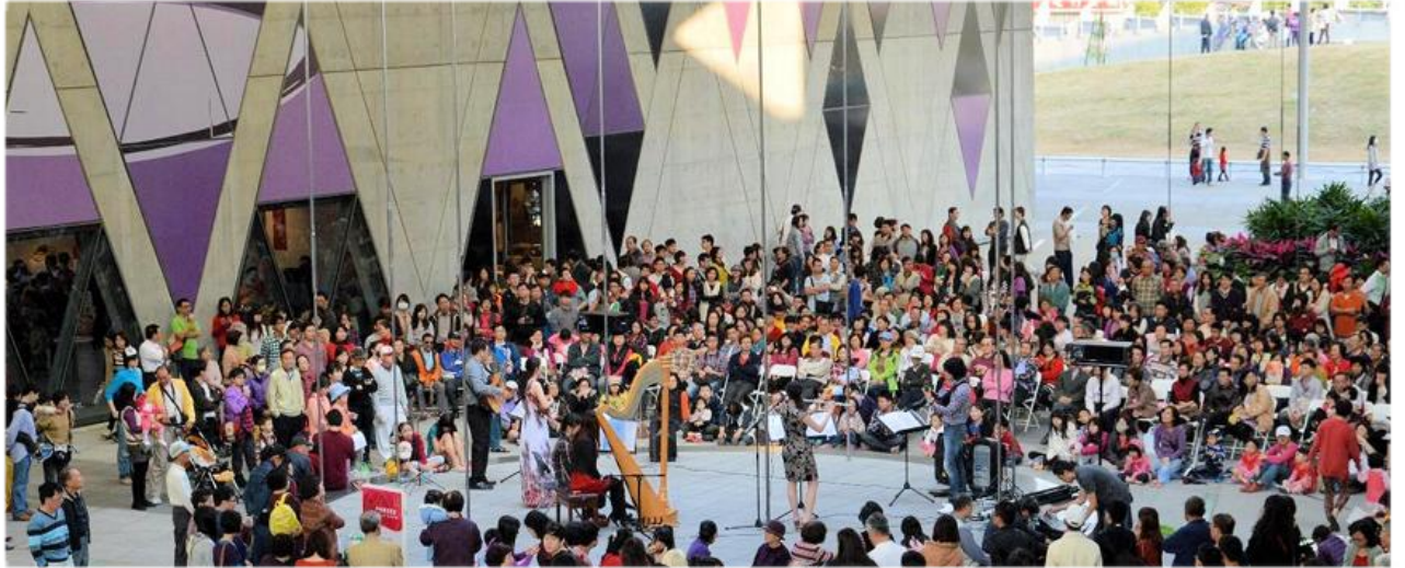
▲ 大東文化藝術中心『戶外舞台音樂會』