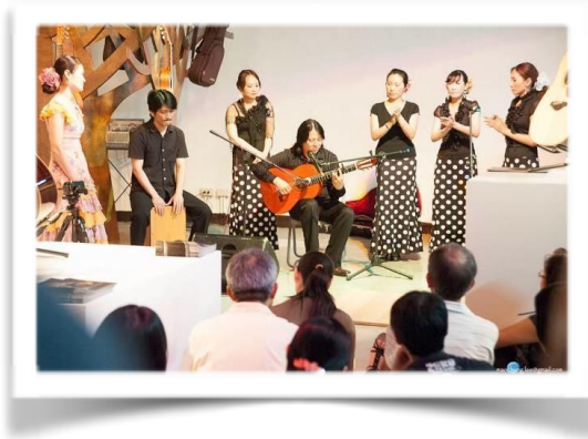
▲ 衛武營藝術文化中心籌備處 2012 年『夏日吉時樂—國際吉他演奏會暨樂器展』