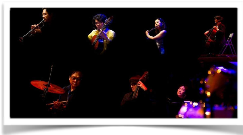
▲ 衛武營藝術文化中心籌備處 2011 年『清涼藝夏音樂會』