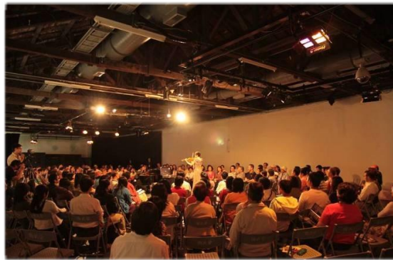
▲ 衛武營藝術文化中心籌備處 2010 年『春季三部曲』